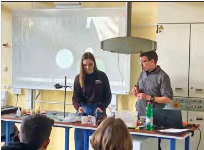
Bilder und Text: Felix Schreiner

Wir bedanken uns herzlich für den spannenden Vortrag, der auch viele Ideen für die Experimentierküche daheim zu bieten hatte.