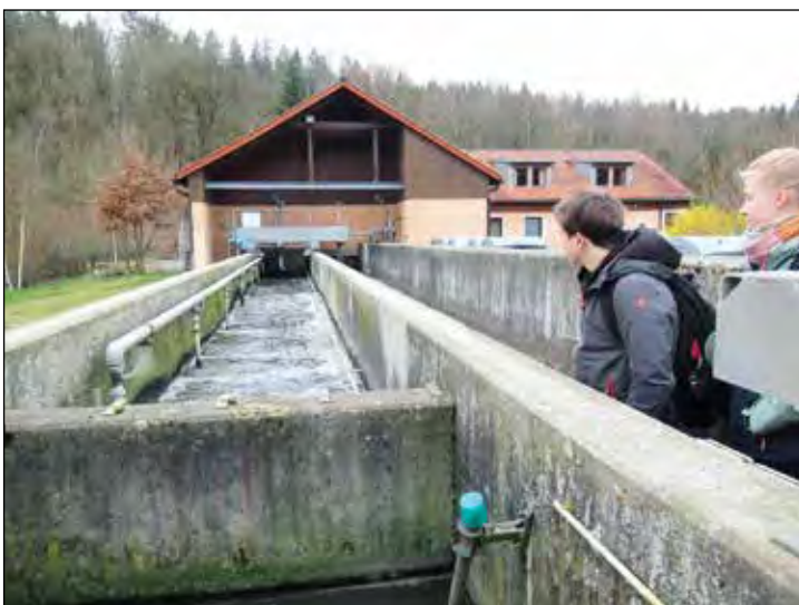
Helena Röh 8b (Text)