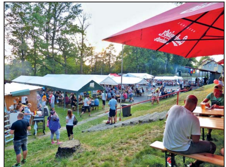
Gut gefüllter Festplatz am frühen Abend