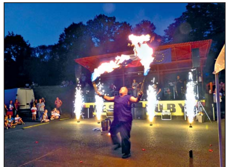
Der Fakir legt los!