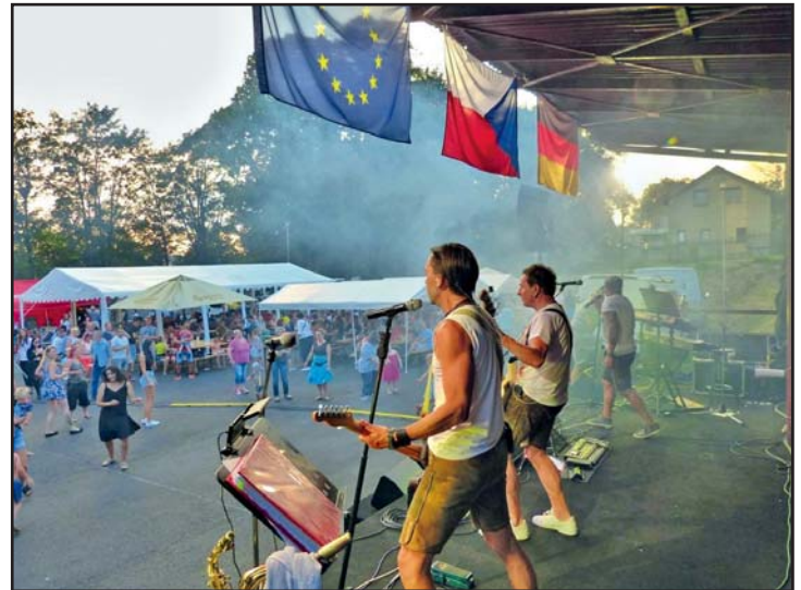
Die Musik begeistert Alt und Jung