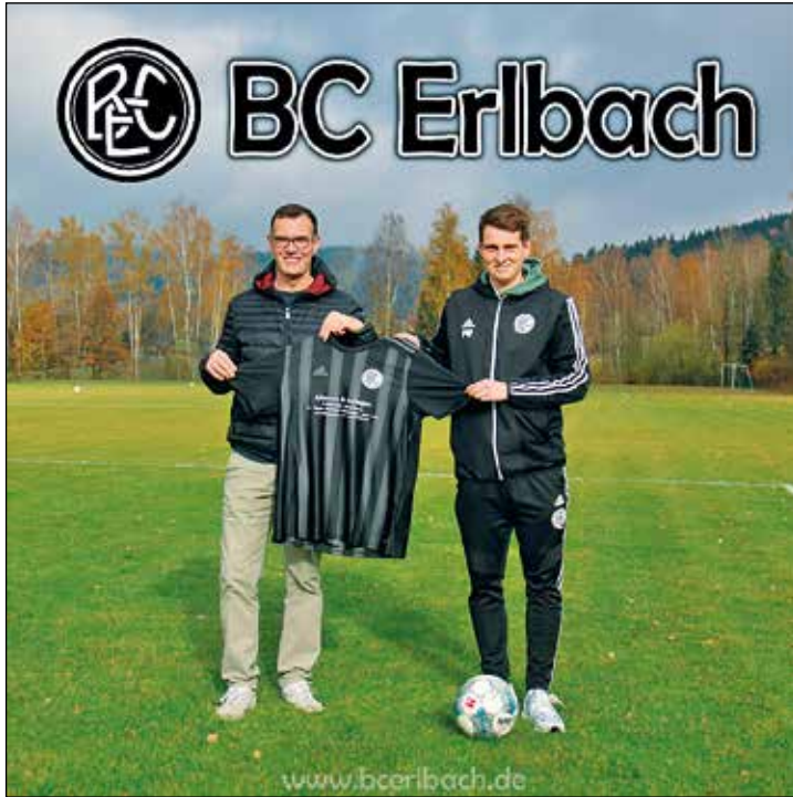
Die 1. Herrenmannschaft bedankt sich recht herzlich bei der Rechtsanwalts- und Steuerkanzlei Alberter & Kollegen für einen neuen Trikotsatz.