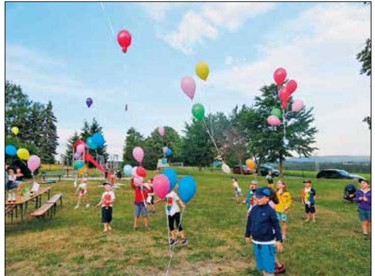
Gute Wünsche schweben gen Himmel.

Gedankt sei weiterhin der Stadtverwaltung Markneukirchen für die Bereitstellung der Räumlichkeiten und Außenanlagen der Alten Schule in Breitenfeld, ferner der Firma Lebensgarten in Adorf und den Bad Brambacher Mineralquellen für ihre Sachspenden und – last, not least – dem Organisationsteam der Wackelzähneltern für die tolle Vorbereitung und Durchführung eines unvergesslichen Tages. (ew)