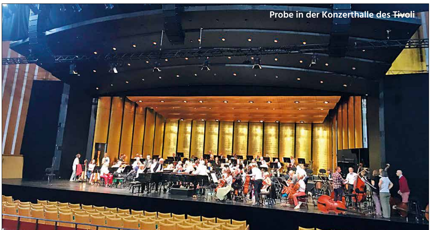
Probe in der Konzerthalle des Tivoli