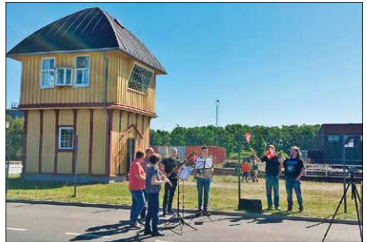
Abschlussständchen am Stellwerk der Olsenbande am Fährterminal Gedser