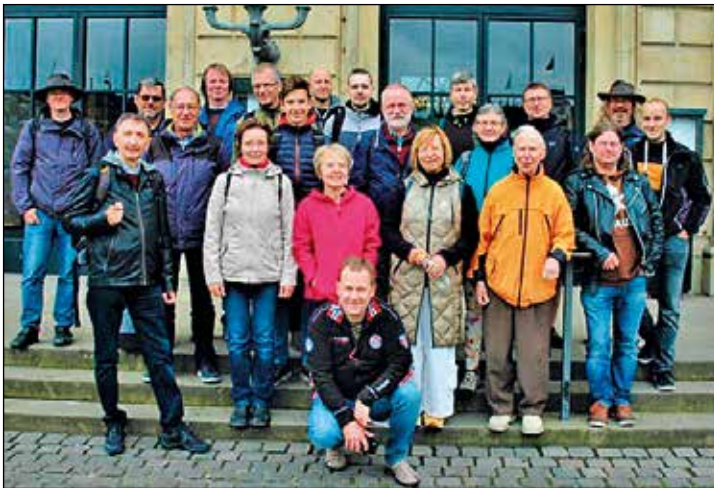
Mitglieder des Sinfonieorchesters vor dem königlichen Theater in Kopenhagen

Auf dem Rückweg verabschiedete sich das Holzbläserquintett des Stadtorchesters standesgemäß musikalisch von Dänemark. Am Originalstellwerk der Olsenbandefilme in einem Eisenbahnmuseum am Fährterminal in Gedser intonierte man die gleichnamige Filmmusik.