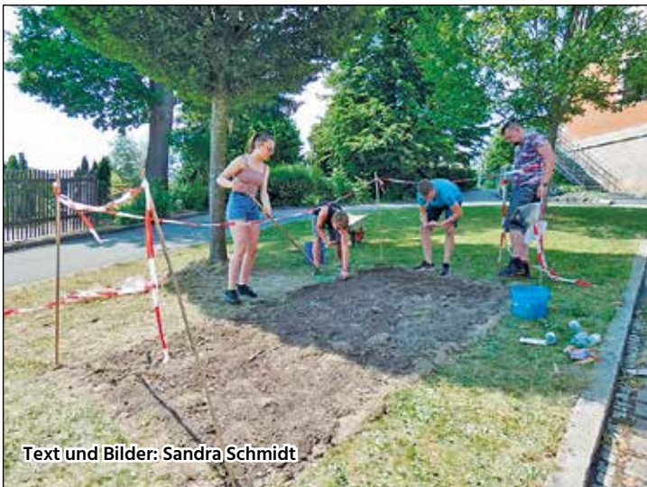
Text und Bilder: Sandra Schmidt