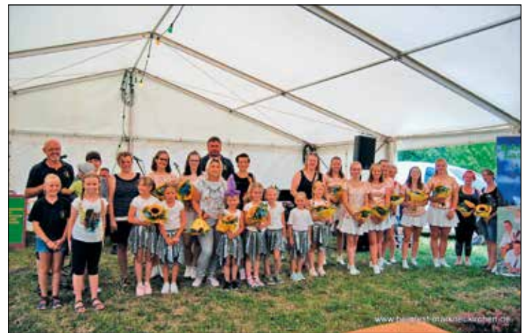
Der Adorfer Carnevalsverein mit seinen Akteuren und den begleitenden Eltern.