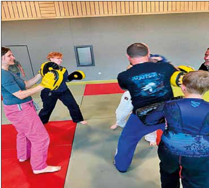
DARTKELLER ERLBACH E.V.

veröffentlicht. Die Teilnehmerzahl wird beschränkt sein, Teilnahme unter vorbehaltlicher Auswahl.