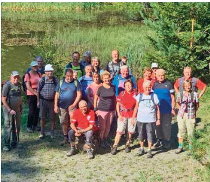
Am Pfarrteich in Landwüst