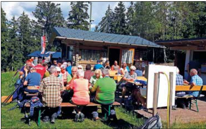
Rast an der Berghütte

In der Hoffnung, dass es allen Wanderfreunden gefallen hat, möchte sich der Wanderverein bei den Teilnehmern und natürlich auch bei den Wanderleitern für die Ideen und die Absicherung der Wanderungen bedanken.