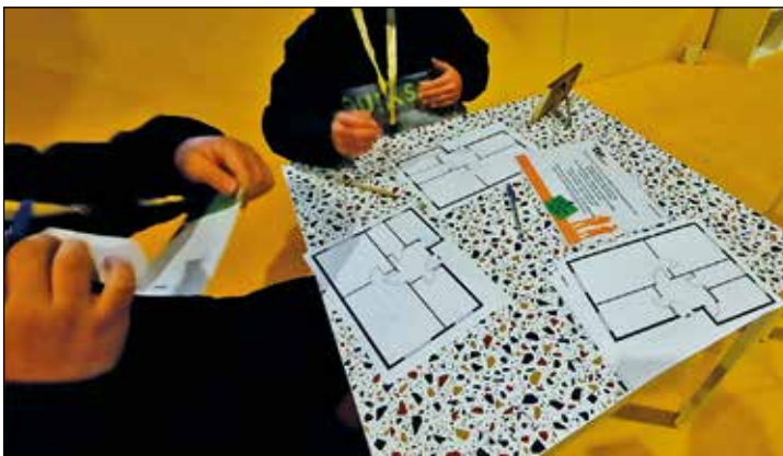
Wie soll die erste eigene Wohnung mal aussehen