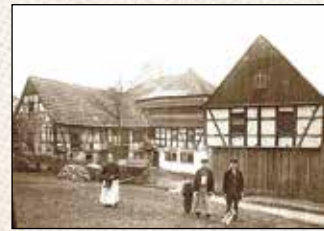
Helmuth Eßbach Heimat- und Geschichtsverein Erlbach e. V. Band V

Wer sich über fünf Jahrzehnte bemüht, aus den Aktenbeständen zur Vergangenheit und Volkskunde seines Geburtsortes zu schöpfen, der entwickelt eine besonders enge Bindung zu seinem Heimatdorf und dessen Bewohnern. Man könnte das auch Liebe nennen. Die Erkenntnisse aus der Geschichte sind Mahnung und zugleich Lehre für die Zukunft. Hegen wir die Hoffnung, dass diese auch wahrgenommen werden!