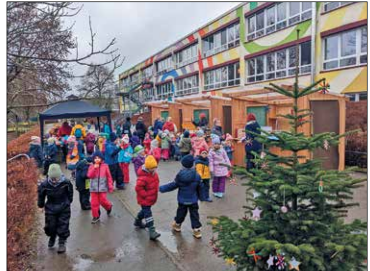
Weihnachtsmarkt im Kinderland