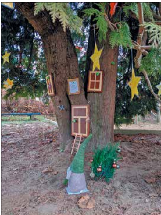
Einzug der Weihnachtswichtel

Die Teams der Einrichtungen Sonnenblick und Kinderland wünschen allen eine schöne Adventszeit, ein besinnliches Weihnachtsfest und einen guten Rutsch ins neue Jahr.