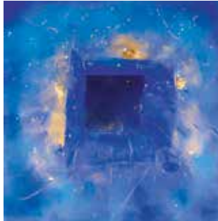
Annette Weber-Vinkeloe Apostelgeschichte 9

Lassen Sie sich einladen, mit auf eine bereichernde Entdeckungsreise zu gehen.