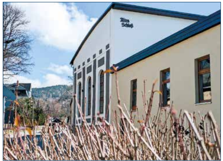
Außenansicht Altes Schloss von der Kirchstraße

Bei restlos ausverkauftem Saal zeigten die Musiker ihr Können und begeisterten die Zuhörer, die auch ausnahmslos positiv überrascht waren, wie schön ihr neues Altes Schloss geworden ist.