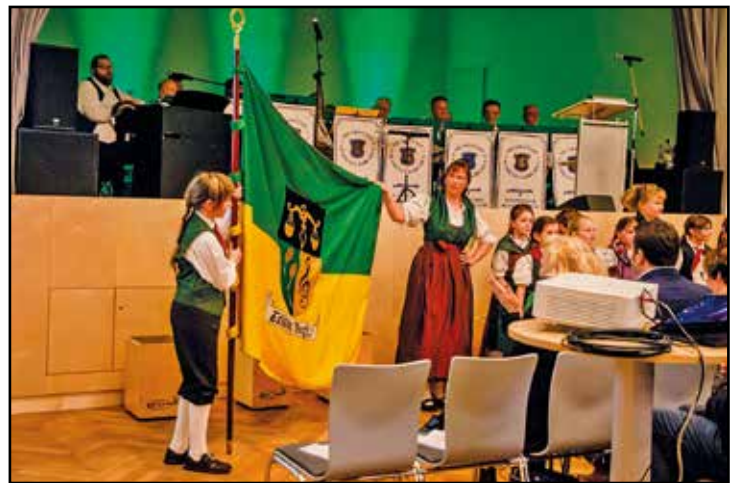
Kindertrachtengruppe eröffnet Festveranstaltung