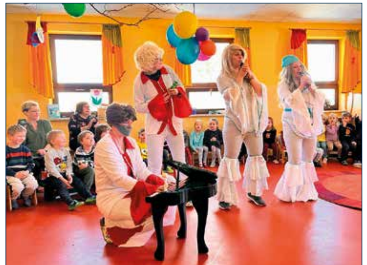
Auch Besuch aus Schweden war da!