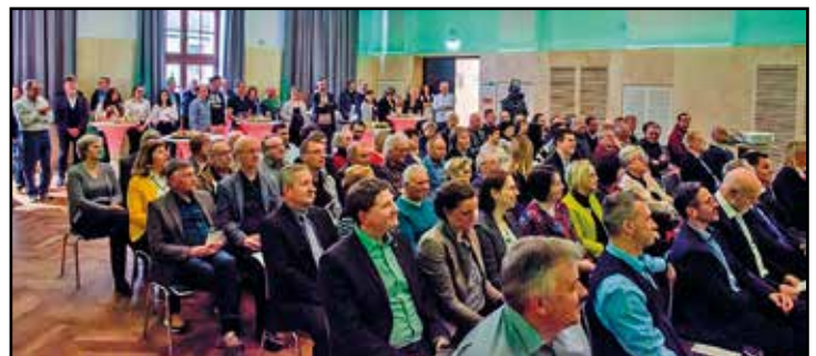
Vollbesetzter Saal