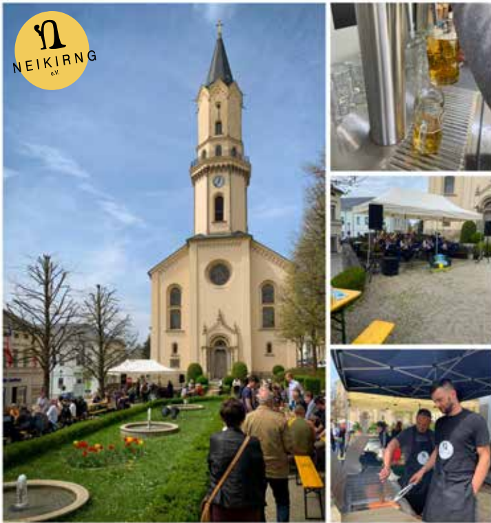
Am Sonntag, den 07.05, luden wir zu einem zünftigen Fröhschoppen mit den Dreiländereck Musikanten ein. Bei herrlichem Sonnenschein fanden sich einige Neikinger auf dem mittleren Markt ein, um bei Bier, Roster, Steak, Kaffee und Kuchen einen schönen Vormittag zu verbringen. Euer Neiking e.v.