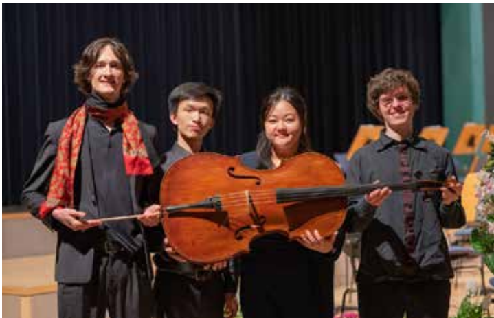
Die Finalisten im Fach Violoncello, Foto: Daniel Hoffmeyer