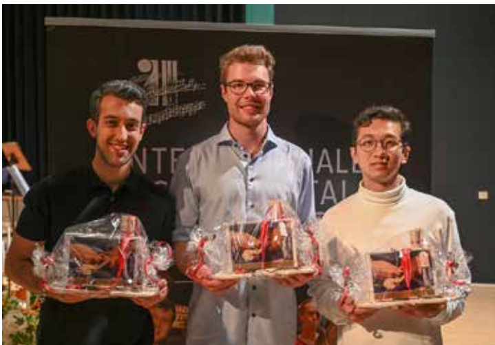
Die Preisträger im Fach Kontrabass

Neben der finanziellen Förderung durch den Kulturraum Vogtland-Zwickau, die Kulturstiftung des Freistaates Sachsen, den Vogtlandkreis, die Stadt Markneukirchen, die Sparkasse Vogtland, die Volksbank Vogtland-Saale-Orla, die Firma Jürgen Voigt, die Merkur Privatbank, enviaM und EinsEnergie waren es zahlreiche Sponsoren, die den Wettbewerb mit der Stiftung von Preisen bereicherten und unterstützten. Eine Sonderausgabe der Markneukirchner Zeitung wird darüber demnächst ausführlicher berichten. Sie berichtet zudem von zahlreichen Höhepunkten aus den Veranstaltungen, die die Wettbewerbstage begleitet haben: Vom gelungenen Sinfoniekonzert zur Eröffnung und dem mitreißenden Blaskonzert, das vom Chor des Gymnasiums bereichert wurde, bis hin zu Frühschoppen, Museumsnacht, Vorträgen und dem abschließenden Preisträgerkonzert.