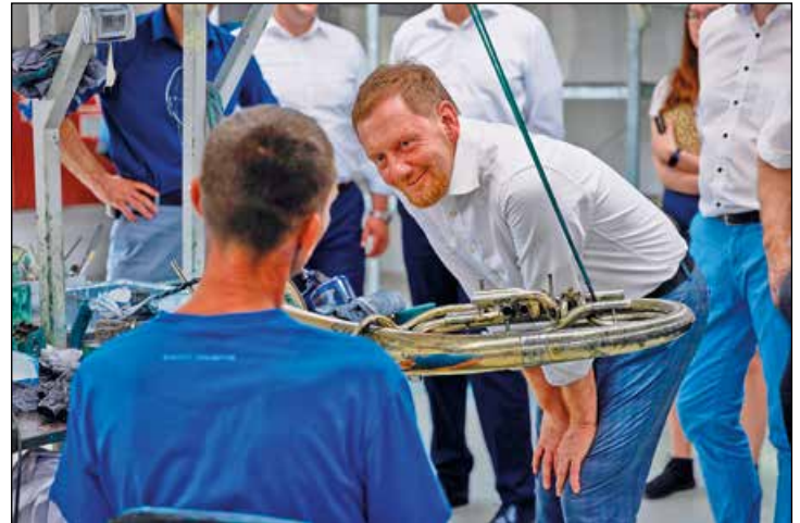
Der Ministerpräsident des Freistaates Sachsen, Michael Kretschmer, spricht mit einem Mitarbeiter der Buffet Crampon GmbH in der Produktionsstätte für Blechblasinstrumente während der Herstellung eines Tenorhorns.

Einen weiteren Besuch stellte Michael Kretschmer für die Produktionsstätte Holzblasinstrumente der Buffet Crampon Deutschland GmbH in Markneukirchen in Aussicht.