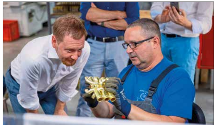
Der Ministerpräsident des Freistaates Sachsen, Michael Kretschmer, spricht mit einem Mitarbeiter der Buffet Crampon GmbH in der Produktionsstätte für Blechblasinstrumente während der Herstellung eines Ventilstocks für tiefe Blechblasinstrumente.