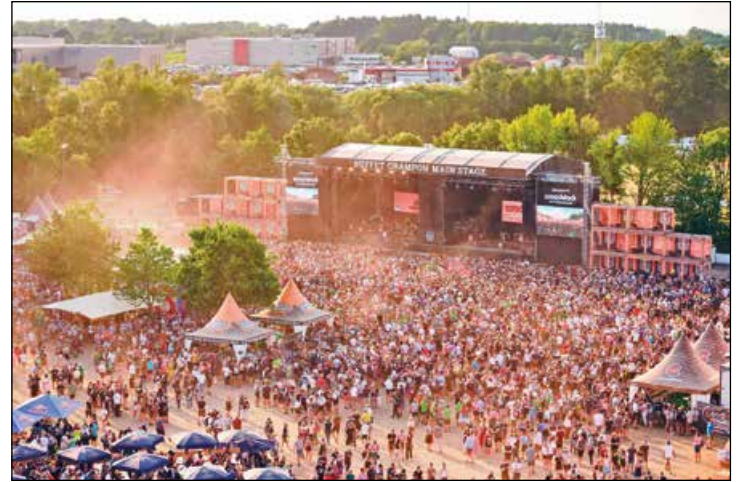
Die Buffet Crampon Mainstage auf dem Woodstock der Blasmusik während des Gesamtspiels, bei dem 19.000 Besucher des Festivals gemeinsam musizierten.