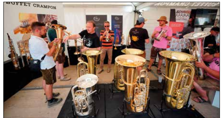
In der Buffet Crampon Lounge probierten Gäste des Festivals Instrumente aus.