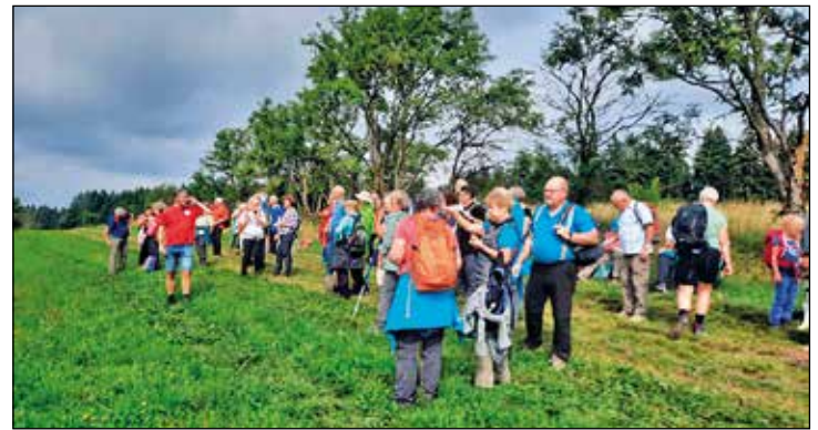
Ausguck am Elstergebirgsweg