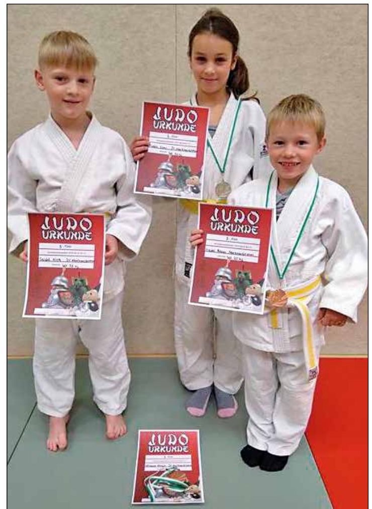
nicht im Bild: Avelyn Ullmann

Ein großer Dank geht an die Eltern, die ihre Kinder an dem Tag zum Wettkampf führen und vor Ort selbst betreuen.