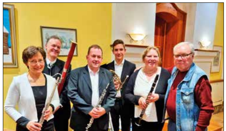
Das Holzbläser- Quintett spielte zum Ständchen auf