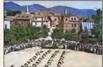
Helmuth Eßbach Heimat- und Geschichtsverein Erlbach e. V.