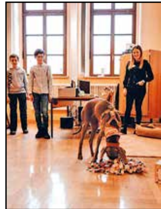
Schulhündin Coco im Einsatz

Ein Beispiel dazu war die Frage, ob es Hunde gibt, die Schwimmhäute haben. Ja, das gibt es tatsächlich! Der kreative Aspekt durfte auch nicht fehlen und so