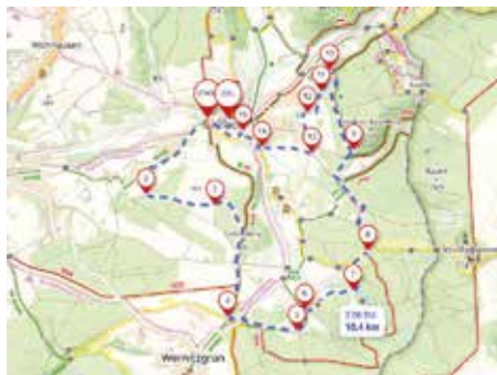
(Karte: Ausschnitt aus Mapy.cz)

Start am Marktplatz – Lindenhöhe – Galgenberg – Schloßpenzel – Am Hopfen – Waldschänke – Lohe Hütte – Kegelbergfuß – Rastplatz Forst-siedlung – Hoher Stein Weg – Erlbacher Park – Ziel Marktplatz