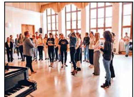
Die Teilnehmenden des Musicals geben einen Einblick

In der Schulaula fand außerdem den ganzen Tag eine öffentliche Probe unseres Musicals statt. Den Besuchern war es möglich, den Ablauf hinter den Kulissen, die Entstehung der Choreografien und die Teamarbeit der Darsteller zu sehen und damit einen Vorgeschmack auf die Auftritte zu bekommen. Schon beim Aufwärmen von Stimme und Körper