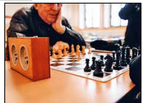
Die Schach-AG war im Zimmer 1.24 vertreten

ten sie uns, wie sie uns überhaupt gefunden hatten und wie sie zu uns kamen. Natürlich gab es dazu ein kleines Quiz, bei dem man schöne Dinge gewinnen konnte.