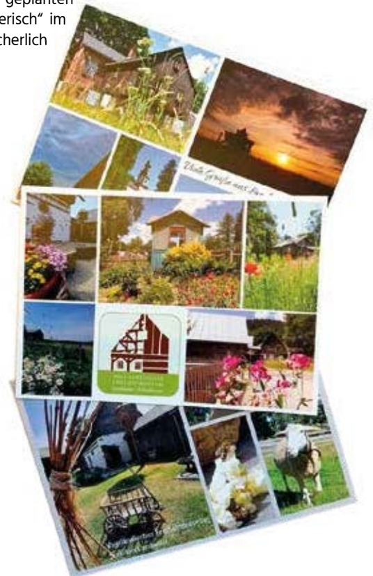
Neue Ansichtskarten von Landwüst und dem Vogtländischen Freilichtmuseum Landwüst/Eubabrunn