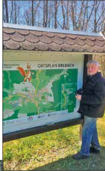
Der Bergwanderverein Erlbach baute am Wanderrastplatz Galgenberg eine neue Bank.

Die Besucher, die jetzt in und um Erlbach wandern, finden nun ihr Ziel auch vor, ohne Riegel an dem Tor.