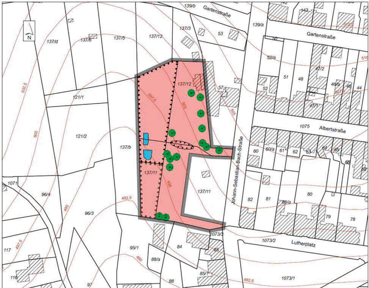
Ausschnitt aus der Planzeichnung der „Ergänzungssatzung Johann-Sebastian-Bach-Straße 5 und 7“, Stadt Markneukirchen, Ortsteil Markneukirchen, Stand Entwurf 05/2021