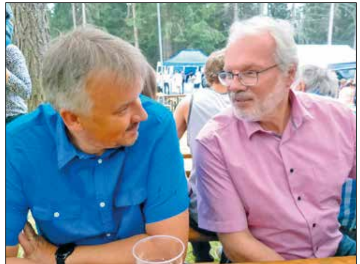
Zwei Bürgermeister beim „Erfahrungsaustausch“