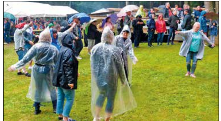
Selbst der Regen, der am späten Nachmittag einsetzte, hielt die Fans nicht vom Tanzen ab.