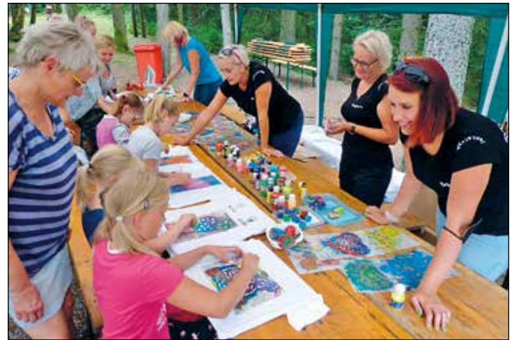
Auch für die Kinder wurde viel geboten. So konnten z. Bsp. wieder T-Shirts bemalt werden.