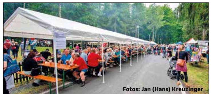
Alle Sitzgelegenheiten wurden genutzt