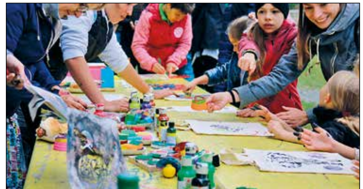
Tolle Stoffbeutel wurden bedruckt und bemalt

Reges Treiben an den einzelnen Stationen