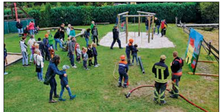
3000 Liter verbrauchte die Jugendfeuerwehr bei der „Brandbekämpfung“