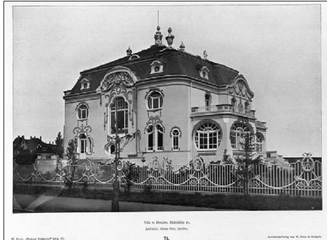
Villa in der Stübelalle 21 in Dresden, Entwurf von Heino Otto

tekturzeitschriften werden Ottos Entwürfe als „Beispiele moderner Baugesinnung“ gewürdigt, von Voretzsch heißt es, er habe um 1900 die Neostile überwunden „und Elemente des Jugendstils mit der Behaglichkeit zeittypischer Landhäuser“ verbunden. Das Äußere seiner Villen blieb dagegen noch von barocken Formen bestimmt. Nur ein Teil ihrer Bauten, zum Teil in einem Villenviertel am Großen Garten errichtet, hat den Zweiten Weltkrieg unbeschadet überstanden. Fotos, die von Heino Ottos Villen in der Stübelallee und Karcherallee erhalten sind, zeigen viele Übereinstimmungen mit der Villa Merz, besonders offensichtlich ist das bei den Formen der Fenster.