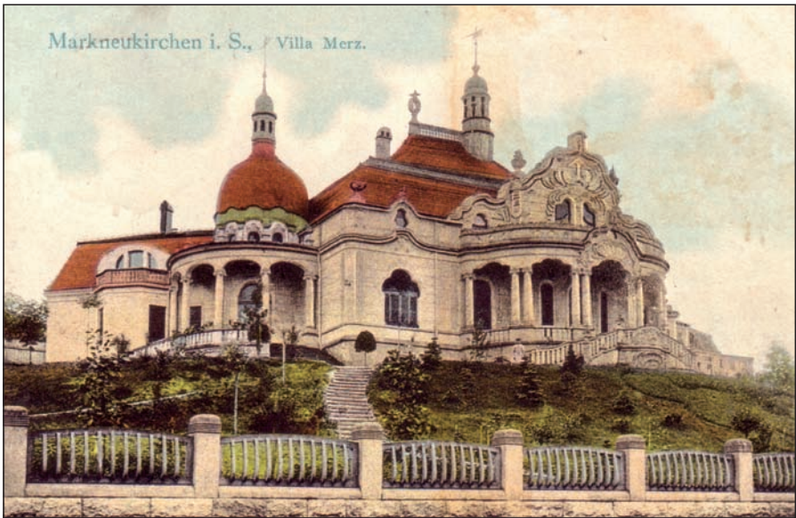
Ansichtskarte der Villa Merz (1909, handkoloriert)

Seit 25 Jahren gibt es in Markneukirchen den Studiengang Musikinstrumentenbau. Sein Domizil ist die Villa Merz in der Adorfer Straße. Dort sind Werkstätten und Seminarräume untergebracht, finden bemerkenswerte Tagungen und regelmäßige Konzertveranstaltungen statt. Das Jugendstilgebäude beeindruckt Einheimische und Gäste gleichermaßen. Fragen zur Geschichte werden gestellt, zu denen es im Jubiläumsjahr des Studiengangs neue Antworten bzw. weitere interessante Fakten gab. Zunächst die Feststellung: Auch die Villa hatte einen runden Geburtstag. Fertiggestellt im Sommer 1903, konnte sie selbst das 110. Jubiläum begehen.