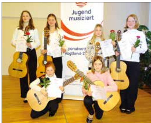
Teilnehmer der Musikschule in der Kategorie Zupf-ensemble