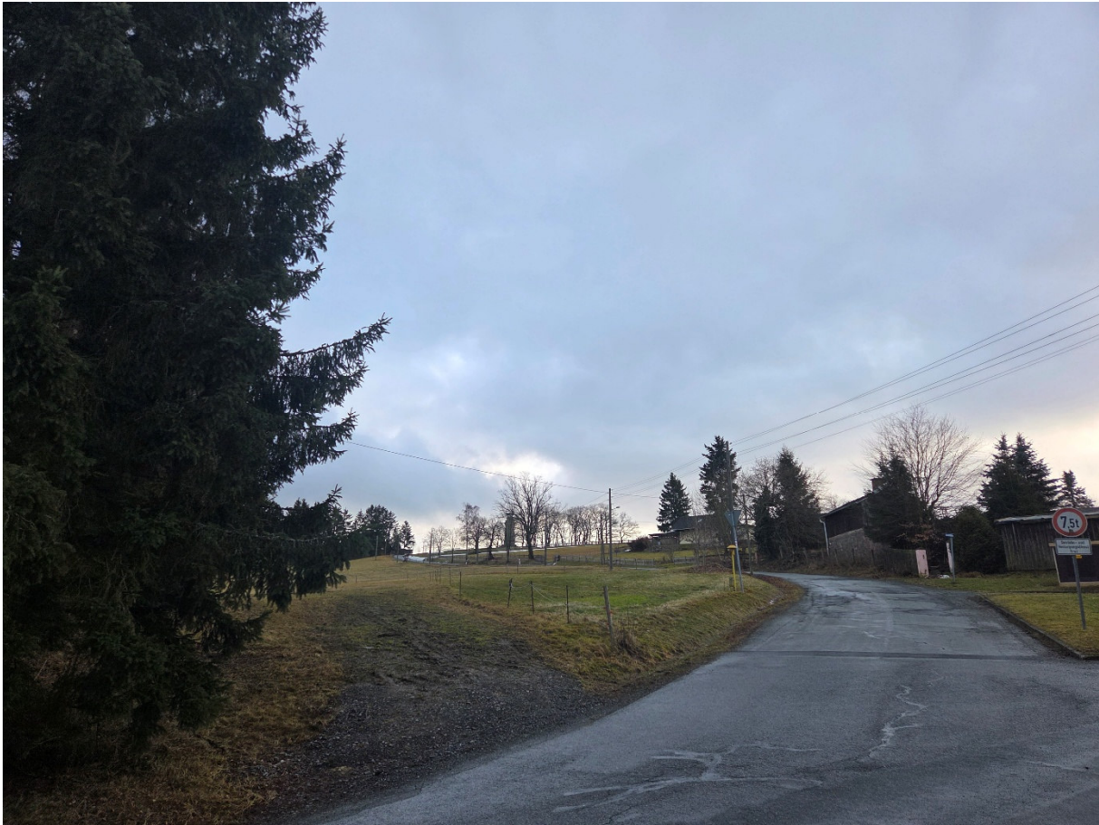
Fotopunkt 2: Egerstraße mit Blickbeziehung aus westlicher Richtung (Fotomontage mit Haus)