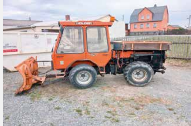
Schneepflug im Mindestpreis nicht enthalten.